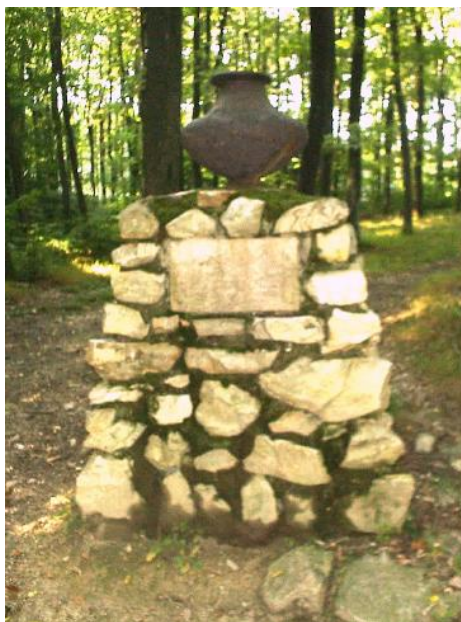
Bella emlékmű Várhely

- az ifjúsági tábor felől a Tolvaj árkon keresztüli mintegy 2 km-es útvonal utolsó harmada rendkívül meredek, ezért csak profi természetjárók részére ajánlható. Előnye viszont, hogy az útvonal kezdeténél buszok számára is alkalmas parkoló alakítható ki. Szintkülönbség szempontjából a legkedvezőbb, bár az egyik leghosszabb útvonal (3,5 km) a Ciklámen tanösvény a Károlymagaslati parkoló – Hétbükkfa – Bella emlékmű állomásokkal. A javasolt kitáblázással egyetértek, a Károlymagaslati parkolónál azonban egy részletes, a vaskori, ill. kelta emlékeket részletesen bemutató információs táblát javasolok.