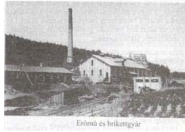
Erőmű és brikettgyár