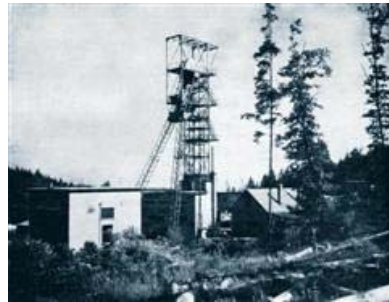
Szent István akna