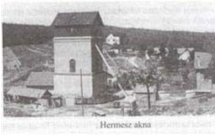
A Hermesz akna