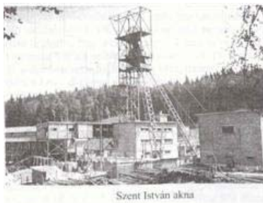
A Szent István akna

A templomot 1928-30-ig, Füredi Oszkár építész-mérnök tervei alapján építették. Még ez év szeptember 28-án szentelte fel Papp Kálmán, soproni város plébános, későbbi Győri püspök. 1938-ban vált önálló lelkeszéggé Brennbergbánya. Az építkezési költségeket gyűjtésekből, országos közadakozásból és az Urikány-Zsilvölgyi Magyar Kőszénbánya Részvénytársaság támogatásából fedezték.